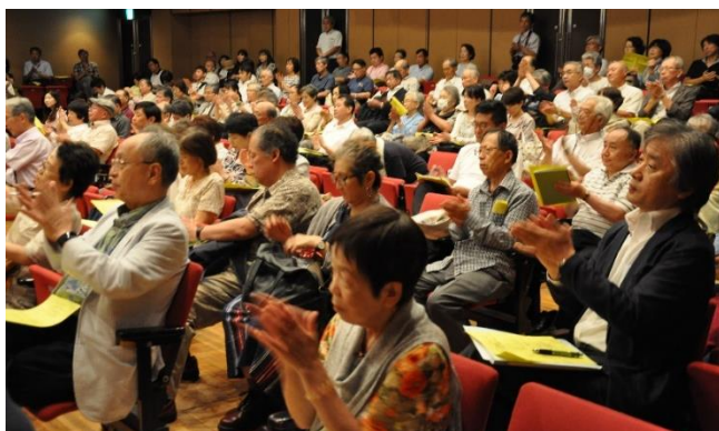
来賓あいさつに拍手する参加者たち。