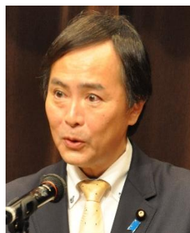
川合孝典参院議員 (国民)参議院厚生労働委員会理事