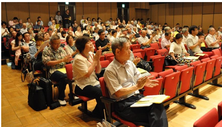
来賓あいさつに拍手する参加者たち。