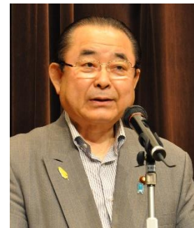
田中和徳衆院議員 (自民)肝炎対策推進議員連盟副会長