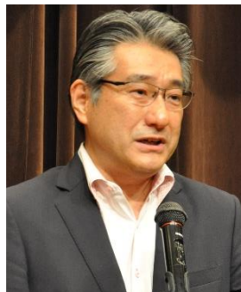
石田昌宏参院議員 (自民)参議院厚生労働委員長