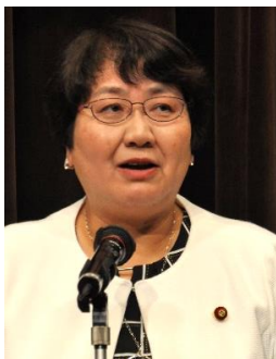
高橋千鶴子衆院議員 (共産)衆議院厚生労働委員会委員