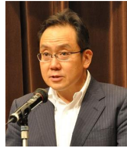
江浪武志・厚労省がん・疾病対策課長