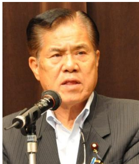
榊屋敬悟衆院議員 (公明)肝炎対策推進議員連盟副会長