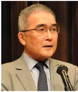
持田智・日本肝臓学会常務理事 (埼玉医科大学教授)