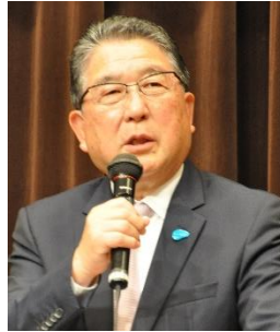
徳光和夫・厚労省「知って、肝炎プロジェクト」メンバー