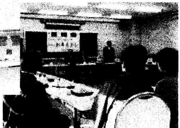
▲新年交流会の様子。飛び入り参加の稲葉小金井 市長から祝辞をいただきました(右起立姿)